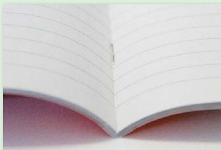
vazba V1 (sešitová)